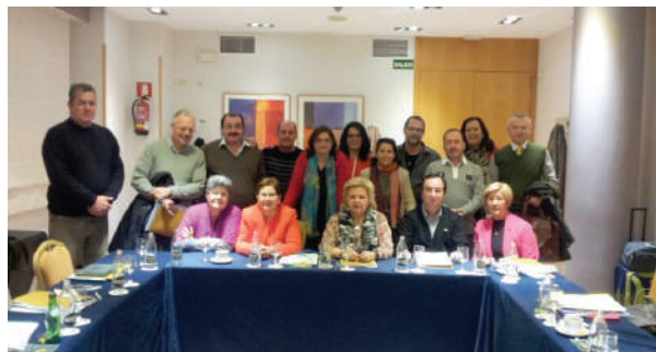
Reunión de delegados de la AVT