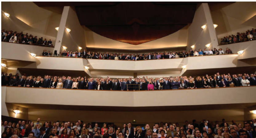
Minuto de silencio durante el concierto In Memoriam