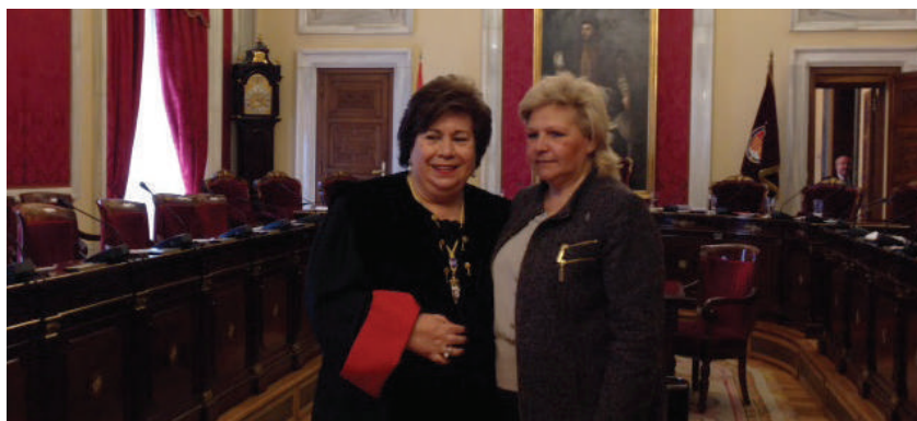
Toma de posesión de la Consejera Electiva de Estado.

El día 3 de febrero se celebró una reunión de trabajo entre la AVT,