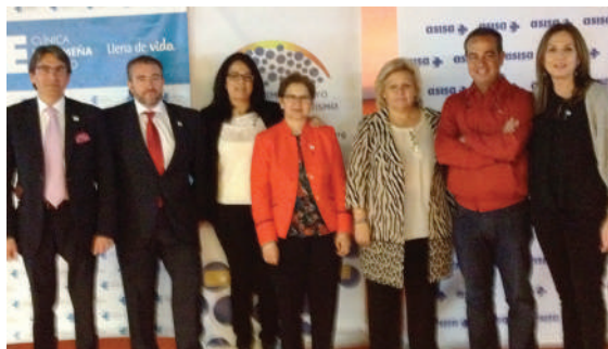
Concierto APAVT en Badajoz