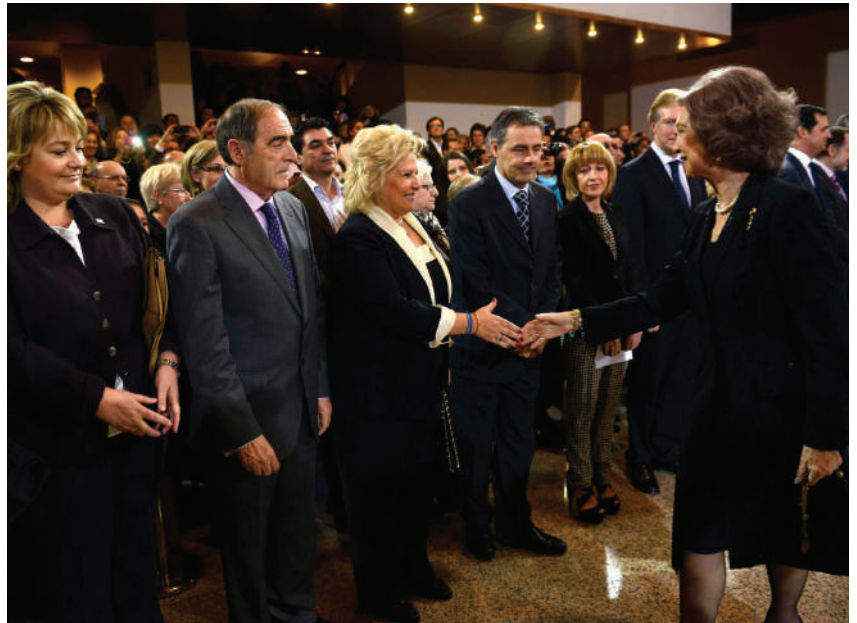
Concierto In Memoriam

La ciudad de Badajoz recordó a las víctimas el pasado día 14 de marzo en la inauguración de un