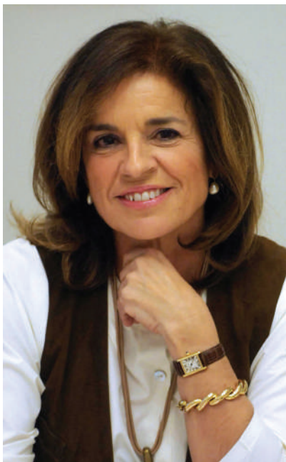
Ana Botella Alcaldesa de Madrid

La capital de España sufrió el 11 de marzo de hace diez años el peor atentado terrorista de nuestra historia. Un ataque que paralizó nuestro país, que conmovió a nuestra sociedad y que vino a sumar más dolor a los 175 crímenes con los que el terror se ha ensañado con nuestra ciudad, durante los últimos cuarenta años. Una ofensiva que ha dejado en nuestras calles 382 muertos, miles de heridos, miles de damnificados. Una historia de dolor que, como Alcaldesa, aseguro con rotundidad que Madrid no olvida: Todos ellos, sus familiares, sus amigos, sus vecinos, permanecen para siempre en nuestra memoria.